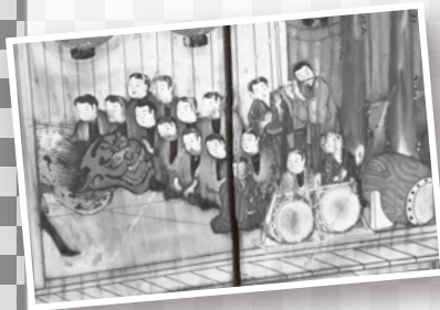
明治23年囃子連奉納絵馬(部分) (馬橋稻荷神社所蔵)

祭りばやしなどの郷土芸能は、お祭りや祝い事などの折に披露され、地域のなかではぐくまれてきました。今日では後継者の減少などの課題を抱えながらも、関係者の努力によりなお受け継がれている地域文化のひとつです。今回の展示では、区内で継承されている祭りばやしを中心に、芸能が受け継がれる場や楽器職人のわざなどについて紹介します。郷土芸能の魅力や、地域文化の継承について理解を深めていただく機会になりましたら幸いです。