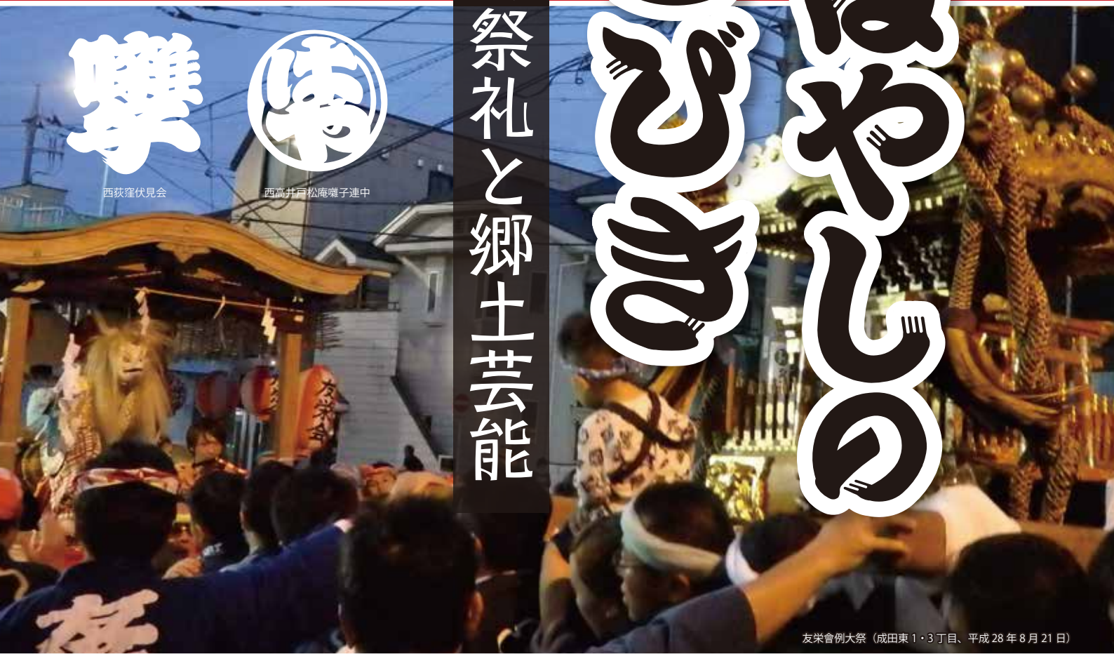
友栄會例大祭 (成田東1・3丁目、平成28年8月21日)