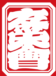
友栄會はやし連中