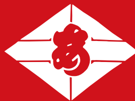
阿佐ヶ谷囃子保存会