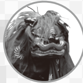
井草囃子・中通囃子連中の獅子舞